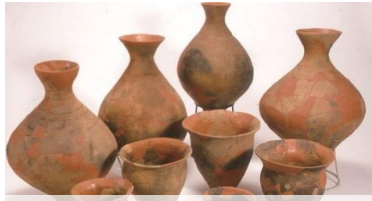
弥生時代中期「北原式土器」

資料館「時の駅」では、弥生時代をテーマとした特別展を開きます。2,300年ほど前、大陸から東海地方へ稲作文化が伝わり、高森でも弥生時代が幕を開けます。弥生時代の遺跡は町内に80箇所ほど見つかっています。弥生時代は稲作と共に金属器の時代ともいわれていますが、高森はどうだったのでしょうか。当時の人たちはどのような暮らしをしていたのか、町内の遺跡から発見された土器や石器などの遺物から探してみたいと思います。