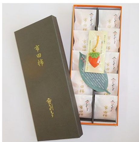
市田柿(10 個入り 300g×2 箱)

農事法人組合フクロウのスタッフが、種まきから収穫まですべてを行い、美味しいお米作りをしています。 （寄付額：20,000 円以上）