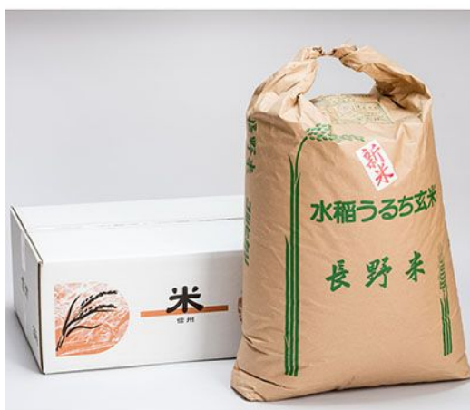
高森産こしひかり 30 kg

減農薬・減肥料・安心・安全にこだわり、天竜水系育ちの美味しいお米です！（玄米もあります！）